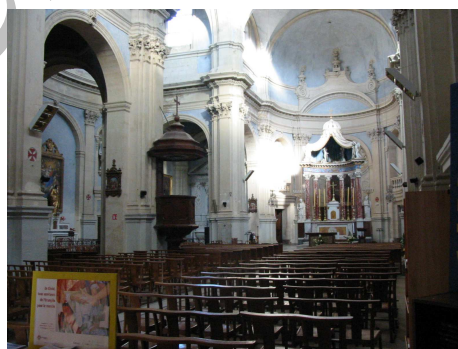
Eglise de 13 Lambesc

Enfin, ne perdez pas de vue que nous portons tous sur nous le meilleur instrument qui soit, NOS OREILLES, il suffit de s'en servir pour juger des résultats. En terme d'intelligibilité il n'y a pas d'autres alternatives que BIEN comprendre ou MAL comprendre.